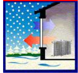
ΚΑΤΑΝΑΛΩΣΗ ΕΝΕΡΓΕΙΑΣ ΣΕ ΚΤΙΡΙΑ ΜΕ ΜΟΝΑ ΚΑΙ ΔΙΠΛΑ ΤΖΑΜΙΑ